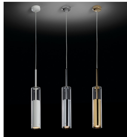
Image does not show north American canopy. La fotografía no muestra el florón de Norteamérica.